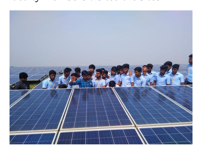
Welspun Renewables Energy Pvt Ltd., Karur

II year Mechanical students of Chettinad Tech went for an industrial visit to Welspun Renewables Energy Pvt Ltd., Karur and NTC Institute of Driver Trainer & Research, Namakkal on 12-12-2018 and 14-12-2018. The visit gave an insight to the students on the new machineries used in the mechanical field. Nearly 45 students along with 3 faculty members visited the sites.