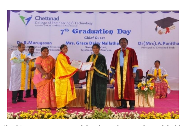
Chief Guest presenting medal and certificate to the rank holder