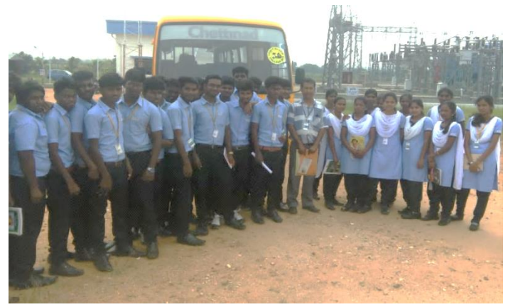
II year EEE students at Welspun Renewables Energy Pvt Ltd .Karur.

II year Mechanical students of Chettinad Tech went for an industrial visit to Welspun Renewables Energy Pvt Ltd., Karur and NTC Institute of Driver Trainer & Research, Namakkal on 12-12-2018 and 14-12-2018. The visit gave an insight to the students on the new machineries used in the mechanical field. Nearly 45 students along with 3 faculty members visited the sites.