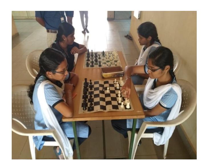
Students participating in the sports events