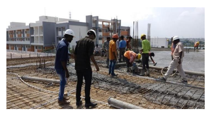
Students at Chettinad Building construction sites