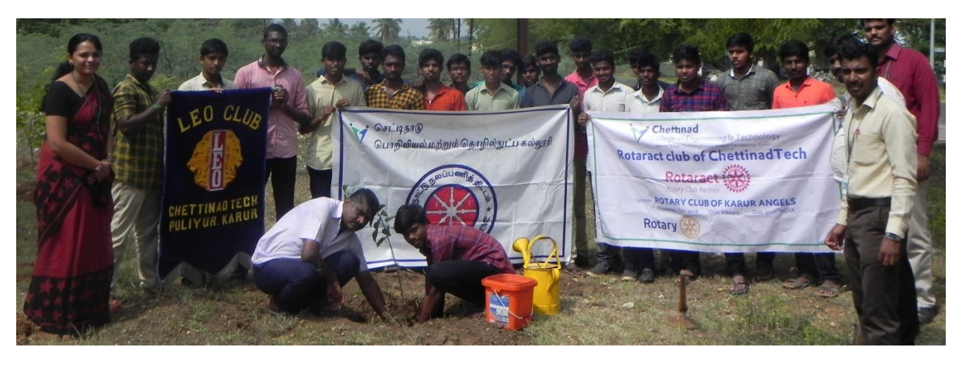
Volunteers of Rotaract Club, Leo Club and NSS planting the sapling

A mega project of planting 5000 saplings in and around Karur district was initiated and organized by all the social clubs of Chettinad Tech (Rotaract Club, Leo Club and NSS) to save the environment. The project began on 17.11.2018 from Melapalayam-Thozhirpettai, Karur.