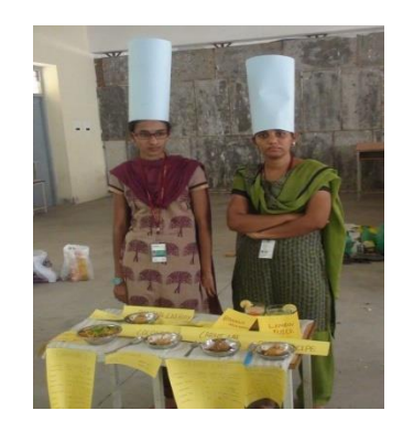
Cooking Withot Fire