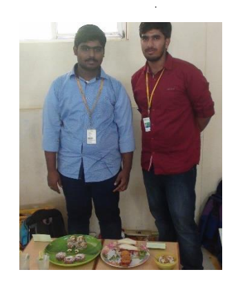
Cooking Without Fire