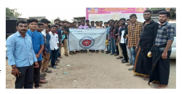
Volunteers of NSS

Annathanam for the devotees of Lord Ayyapa was organized by Sri Devi Karumaariammam Ayyapan Seva Sangam trust, Velliyanai, Karur on 09.12.2018 and 45 NSS volunteers of Chettinad Tech actively participated in serving food to the devotees.