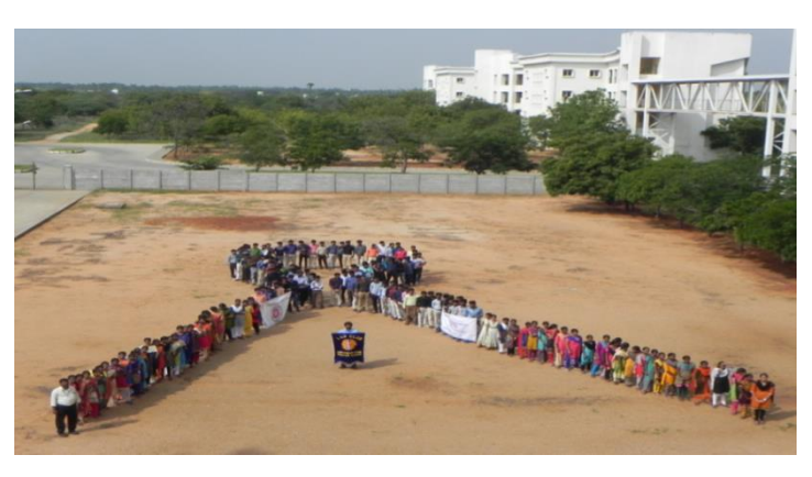
Formation of red ribbon shape

All the social clubs of Chettinad Tech joined hands and arranged an AIDS awareness program on 01.12.2018 at Chettinad Tech campus. The students of Chettinad Tech formed the symbol of Red Ribbon. The red ribbon is the universal symbol of awareness and support for HIV positive individuals.