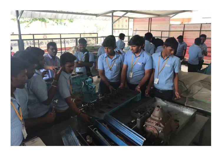
NTC Institute of Driver Trainer & Research, Namakkal