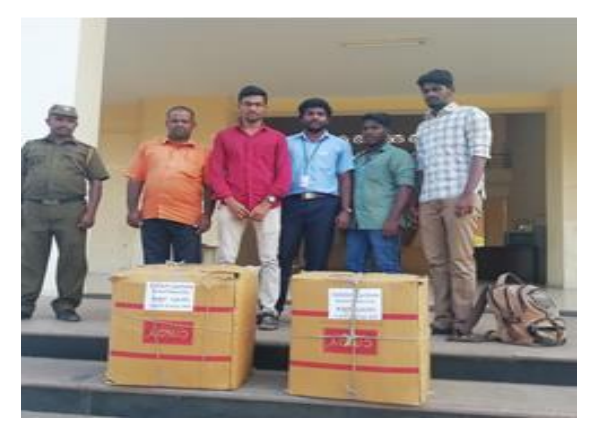
The collected relief materials from Chettinad Tech